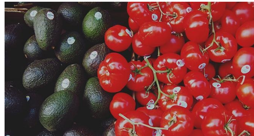
Interfel demande un report de l'interdiction des étiquettes adhésives sur les fruits et légumes frais.